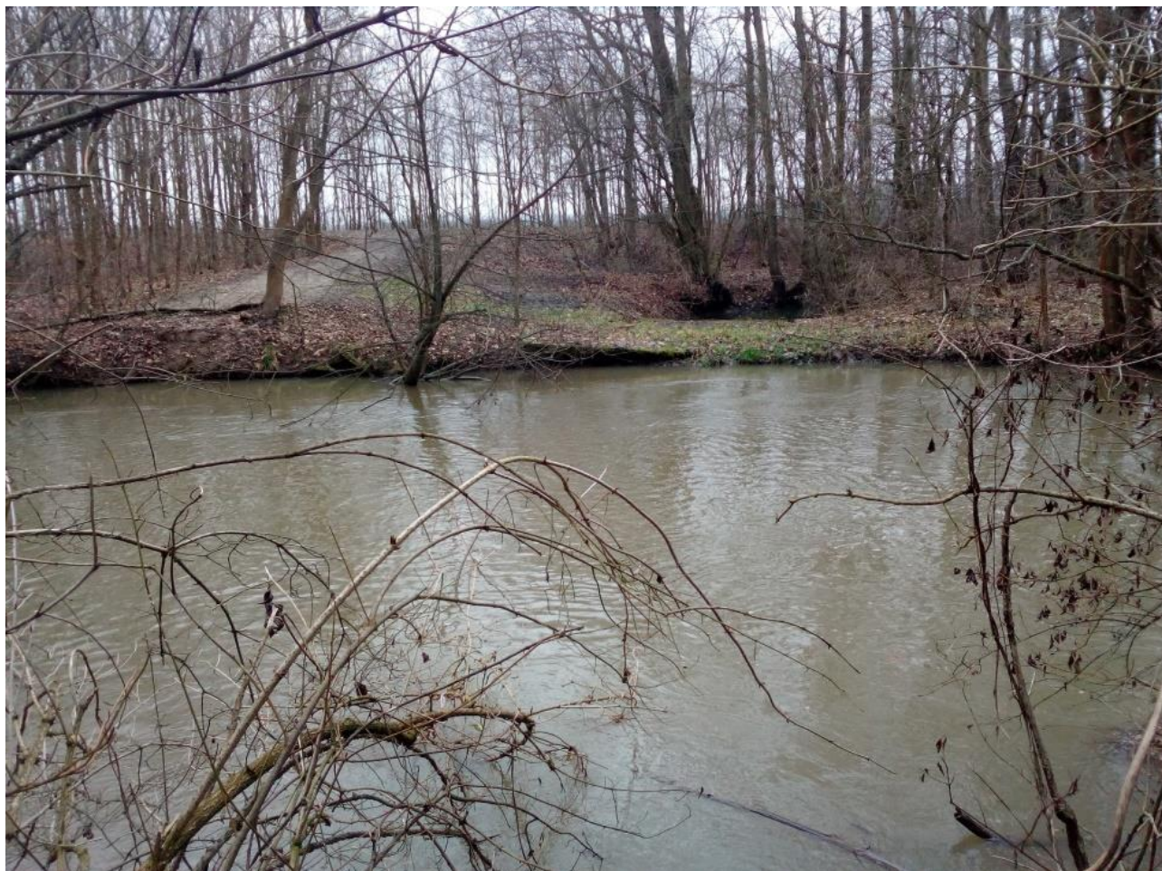
FOTO č.22 – pohled přes Střední Moravu – proti směru shybky (toku Cholinka)