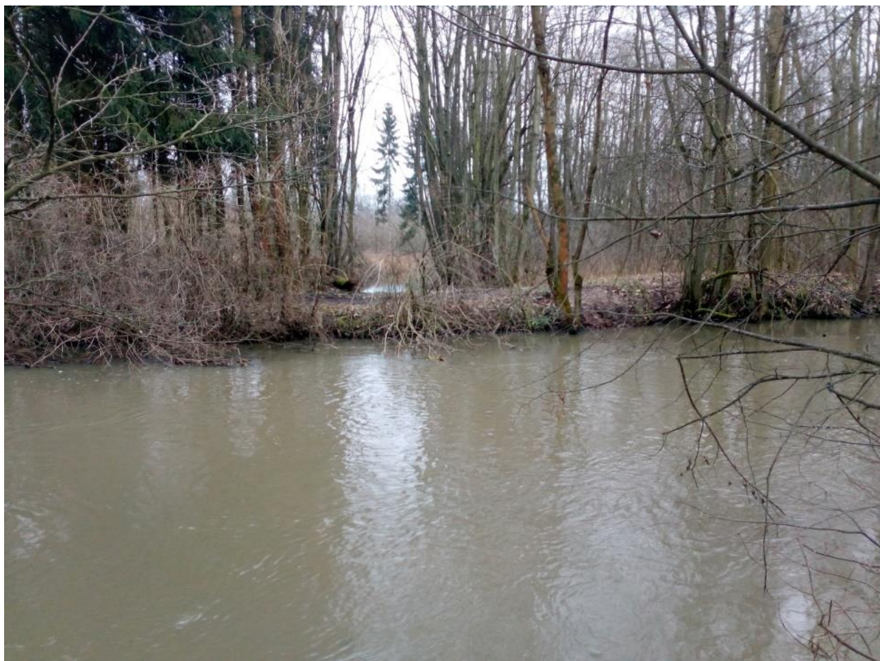
FOTO č.21 – pohled přes Střední Moravu – po směru shybky (toku Cholinka)