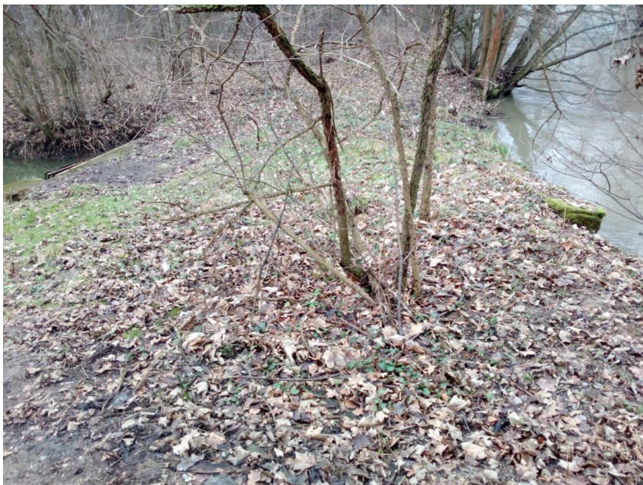
FOTO č.4 – nadzemní dělicí pás mezi vtokovým objektem a Střední Moravou