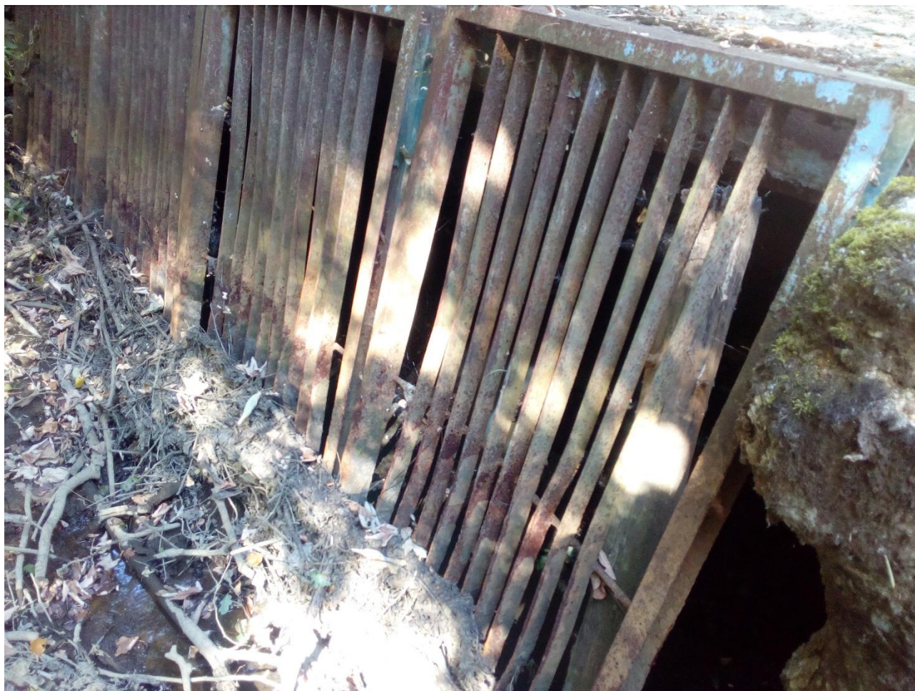
FOTO č.2 – vtokový objekt, betonové čelo překryté železnými česlemi